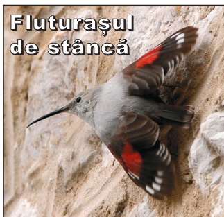
Fluturașul de stâncă