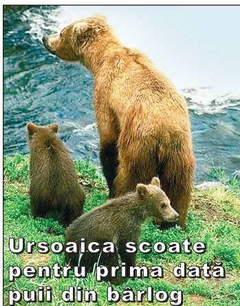
Ursoaica scoate puii din bârlog pentru prima dată