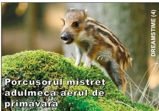
Porcușorul mistret adulmecă aerul de primăvară