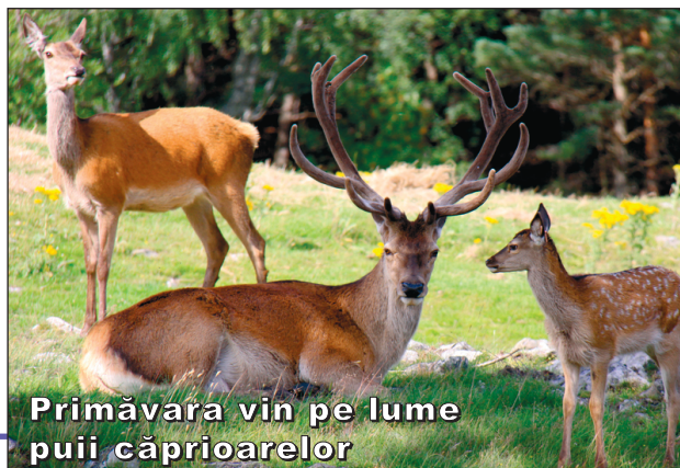
Primăvara vin pe lume puii căprioarelor