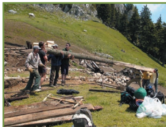
demolarea fostului refugiului, păstrarea materialelor ce puteau fi refolosite și începerea construcției noului refugiului