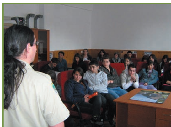
sesiune de prezentare a Parcului Național Buila-Vânturarița în cadrul reuniunii celor două eco-cluburi la Horezu