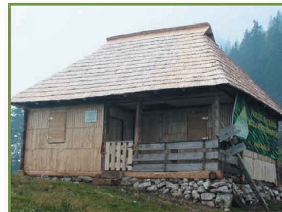
noul refugiul, după reconstrucție :) 20 de locuri la preț în două camere, prispă, punct de informare cu harta turistică și materiale despre PNBV