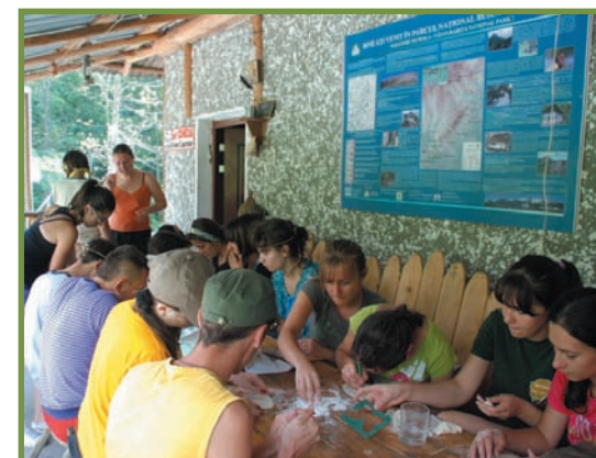
atelier de modelaj de figurine cu inspirație din Natură, realizate din aluat și mici obiecte naturale găsite în pădure și în împrejurimile cabanei