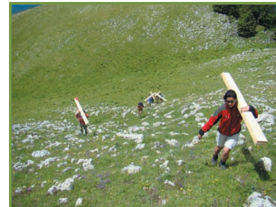
transportul materialelor spre Curmătura Builei