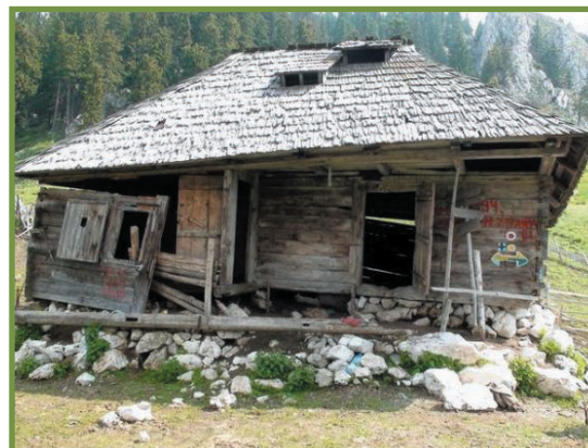
refugiul din Curmătura Builei înainte de reconstrucție

Mulțumim tuturor celor care ne-au fost alături: Administrația Parcului Național Buila-Vânturarița, Obștea Moșnenilor Bărbătești, meșteri din satul Pietreni, voluntari de la Clubul de Turism Vânturarița Rm. Vâlcea, Colegiul Tehnic Forestier Rm. Vâlcea, Cercetașii României - Centrul local Rm. Vâlcea, Eco Alpin Sport Club Caraiman Câmpina și celorlalți iubitori ai muntelui, inimoși și dornici de a pune umarul și sufletul la o astfel de acțiune!