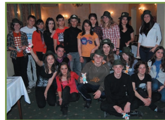
vizita voluntarilor Eco-Clubului Green Future din Vratsa (Bulgaria) în Parcul Național Buila-Vânturarița