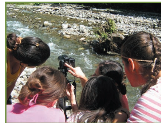
atelier de fotografie în Natură (fotografierea cursurilor de apă și a altor elemente aflate în mișcare)