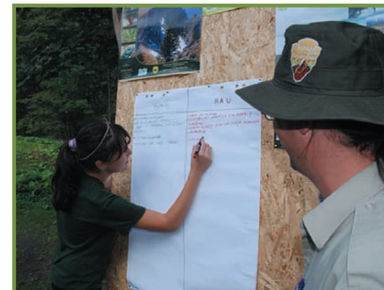
atelier de lucru despre ariile protejate locale și găsirea de metode adecvate de promovare