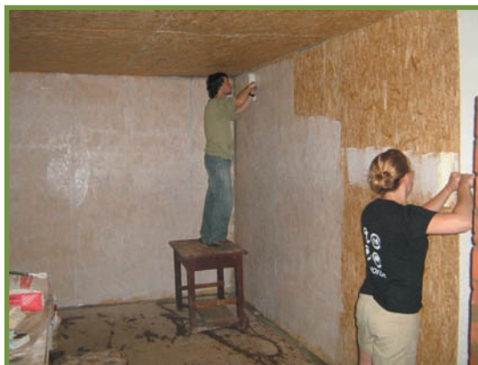
lucrări de reparații în interiorul Cantonului Codric Parcul Național Buila-Vânturarița