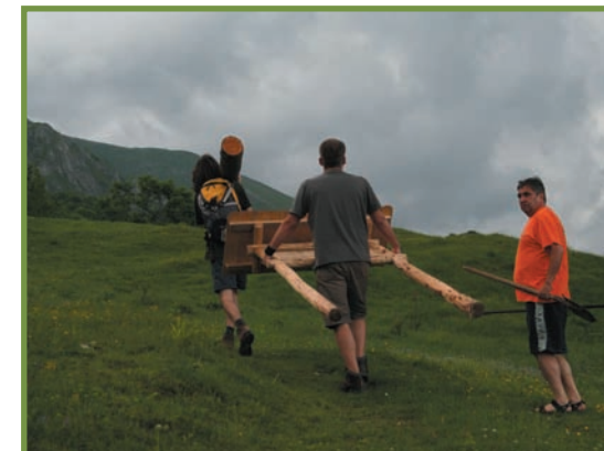
transportul panourilor din Poiana Scărișoara spre Pătrunsa