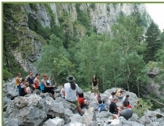
drumeție prin Cheile Cheii și Brâna Caprelor, Parcul Național Buila-Vânturarița