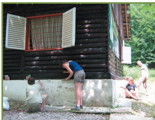
lucrări de reparații și reamenajare Cantonul Codric. Parcul Național Buila-Vânturarița