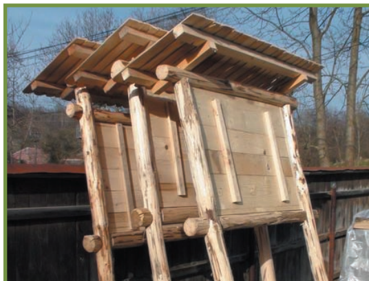
o parte din panourile de pe traseu, în curs de realizare în curtea meșterului tâmplar din satul Costești

* realizarea și amplasarea a 9 panouri informative pe traseul “Poveștile Pădurii”, în zona Pietreni-Scărișoara-Pătrunsa, în Parcul Național Buila-Vânturarița;