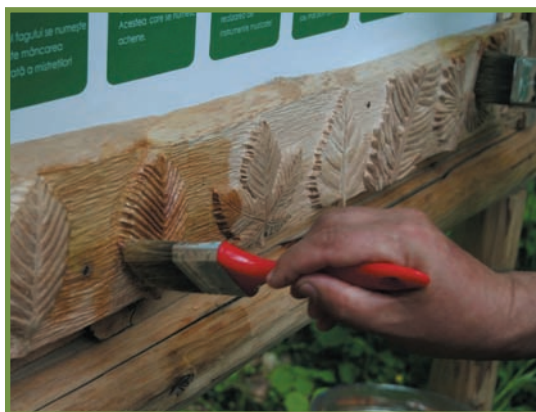
detaliu panou cu sculpturi de frunze

* realizarea unei broșuri ca suport pentru excursiile organizate cu copiii pe traseu. Broșura urmărește și detaliază informația de pe panourile interpretative, alături de câteva jocuri și pagini de completat de către copil.