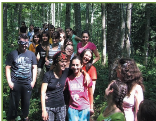
drumeție în pădurea din apropierea cabanei Cheia și joc-animatie de descoperire a speciilor de arbori