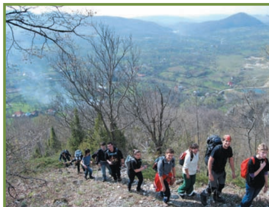
drumeție în Parcul Național Buila-Vânturarița, zona Cheilor Costeștilor