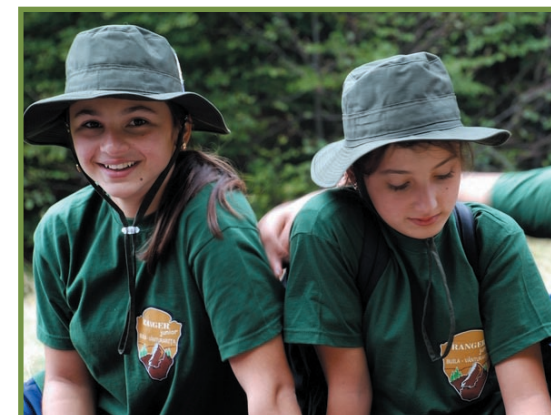
elevi în cadrul taberelor Ranger Junior organizate în Parcul Național Buila-Vânturarița