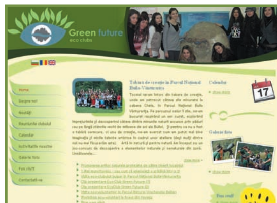
realizarea unei platforme web pentru facilitarea comunicării între voluntari și diseminarea rezultatelor