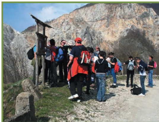
drumeție cu elevii celor două eco-cluburi pe traseul de ecoturism din Parcul Național Buila-Vânturarița