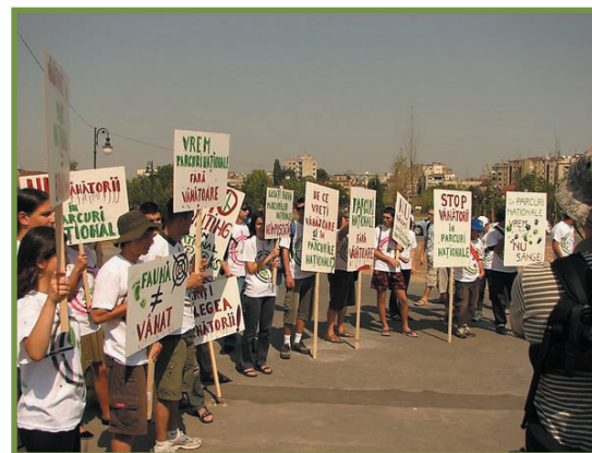
mitingul împotriva vânătorii în Parcurile Naționale

privire spre creasta principală din Parcul Național Buila-Vânturarița, dispere masivul Cozia. Buila-Vânturarița este cel de-al 12-lea parc național din România, înființat în anul 2004. Este un loc minunat pentru plimbări și drumeții pe munte, escaladă și alpinism, vizite la mănăstirile și schiturile de la poalele muntelui, lecții de științele naturii în aer liber și tabere.