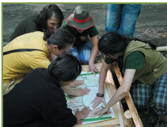
începutul montării primelor panouri