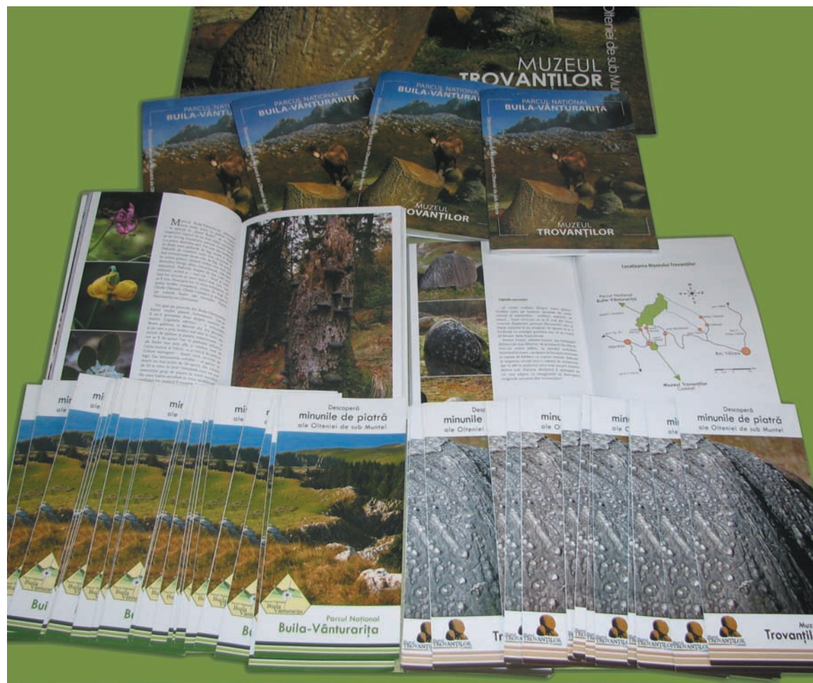
materiale de promovare și informare realizate în cadrul proiectului: set "Descoperă minunile de piatră ale Olteniei de sub Munte - Parcul Național Buila-Vânturarița și Muzeul Trovanților" poster, broșură (84 pag.), pliant;