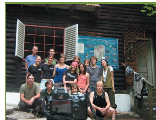
echipa voluntarilor Bouworde 2010 alături de câțiva kogayoni