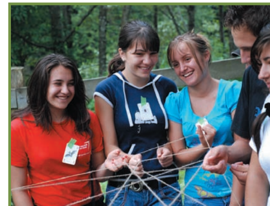
elevii din eco-club înțelegând în mod interactiv și prin joc rolul fiecărui element din Natură