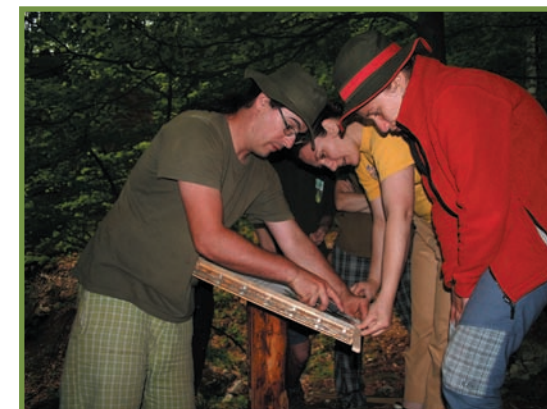
montarea panourilor oblice, în pădurea frumoasă pe poteca spre Pătrunsa