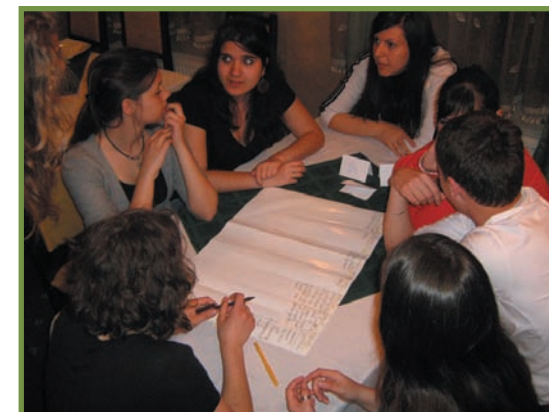
sesiune de lucru cu elevii celor două eco-cluburi