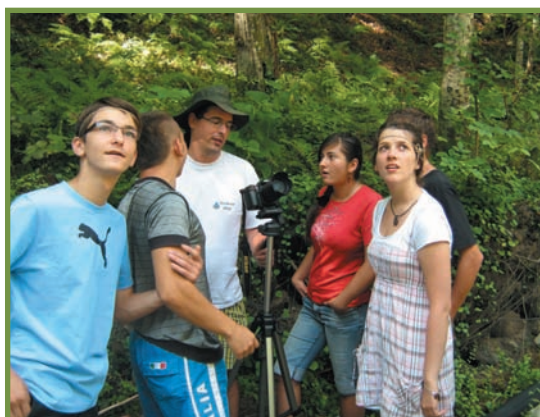
atelier foto despre fotografia de Natură realizat la intrarea în Cheile Cheii, PNBV