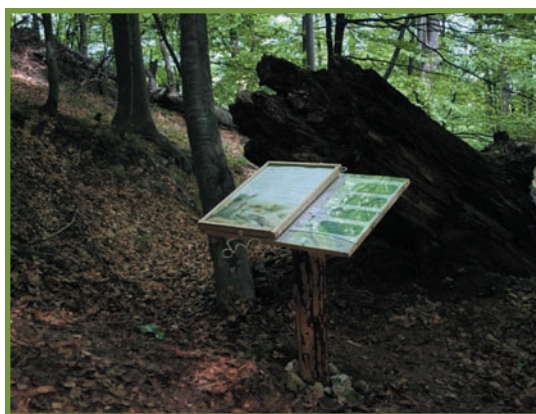
panou cu clapetă, tematica “Viața lemnului mort”