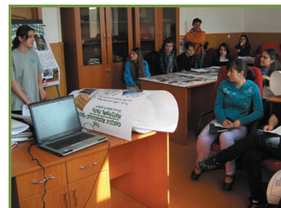
sesiune de prezentări susținute de elevii liceelor din Horezu și Vratsa, pe tema ariilor naturale protejate