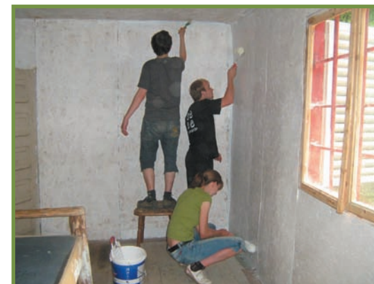
lucrări de reparații în interiorul Cantonului Codric Parcul Național Buila-Vânturarița